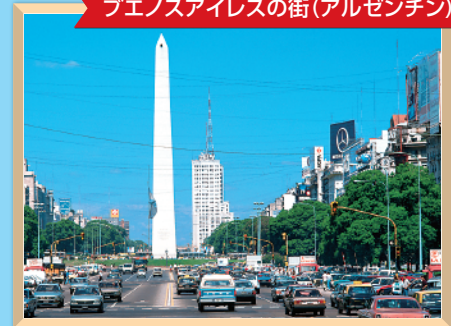
ブエノスアイレスの街(アルゼンチン)