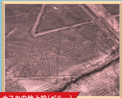
ナスカの地上絵(ペルー)