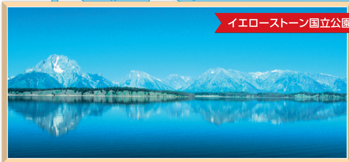
イエローストーン国立公園