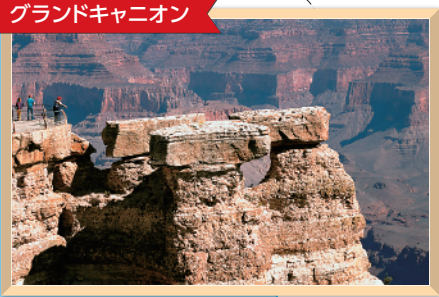
グランドキャニオン