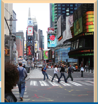
タイムズスクエア(ニューヨーク)