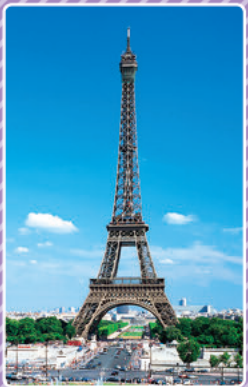
エッフェル塔 (パリ)