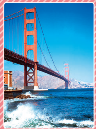
ゴールデンゲートブリッジ (サンフランシスコ)