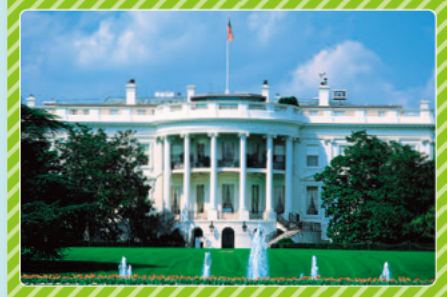
ホワイトハウス(ワシントン)